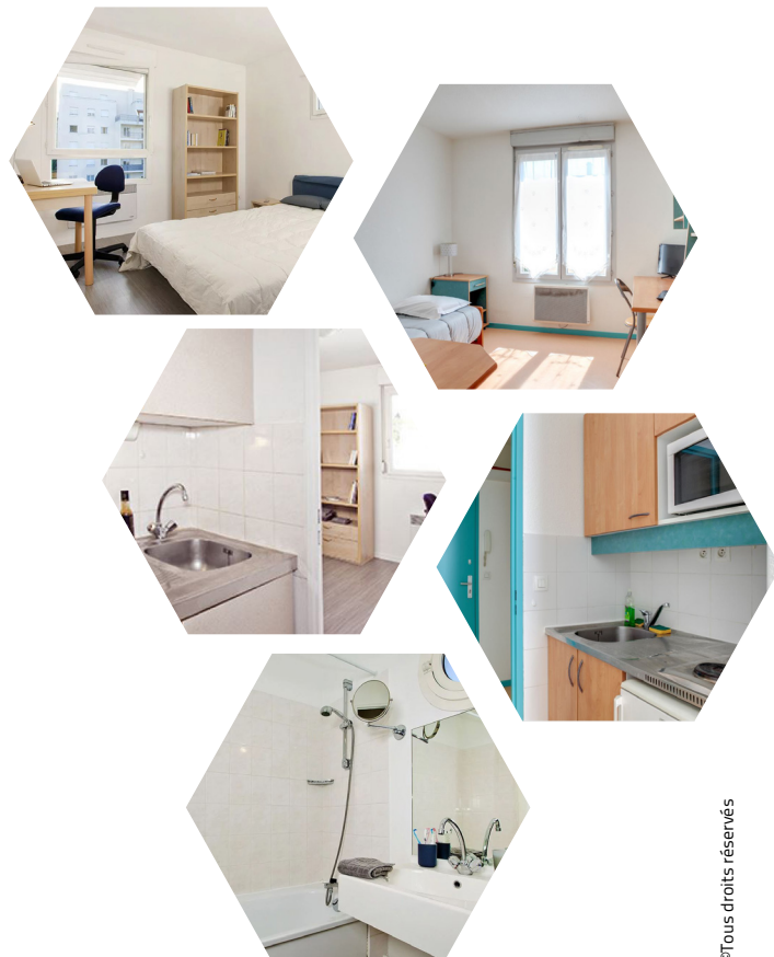
Photos représentatives de nos résidences étudiantes

En pension complète, avec 3 repas par jour inclus Prix mensuel : 690€